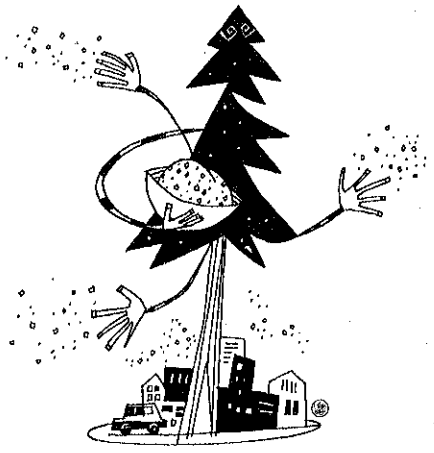
カット/ツトム・イサジ

「右向き、左向きアドレス直しませんか？」シングルの間にいたアドレス、立ち方のヒント、次週2月15日号・2月1日(火)発売定価330円(税込)